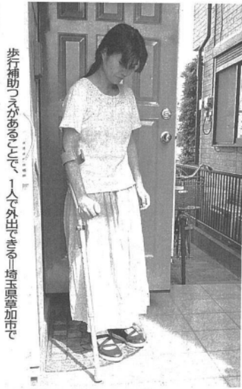
歩行補助つえがあることで、一人で外出できる。埼玉県草加市