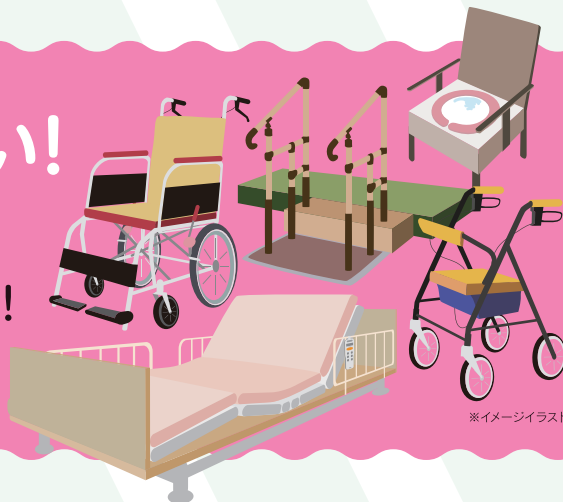
※イメージイラスト

実物体験やデモンストレーション、暮らしに役立つセミナーまで内容盛りだくさん! この機会にぜひご来場ください!