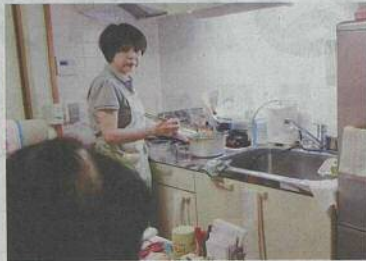
高齢者宅で、生活援助サービスの調理を行うホームヘルパー