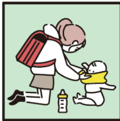
家族に代わり、幼いきょうだいの世話をしている。