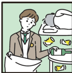
アルコール・薬物・ギャンブル問題を抱える家族に対応している。