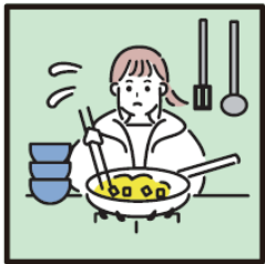
障がいや病気のある家族に代わり、買い物・料理・掃除・洗濯などの家事をしている。

ヤングケアラーを支援につなぐにあたっては、本人の意思を尊重すること、本人や家族の想いを第一に考えることが重要です。本人や家族との対話の中で緊急性を確認した上で、信頼関係を築きながら状況の把握をお願いします。