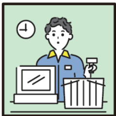
家計を支えるために労働をして、障がいや病気のある家族を助けている。