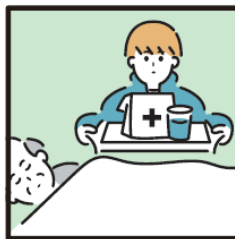
がん・難病・精神疾患など慢性的な病気の家族の看病をしている。