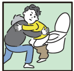
障がいや病気のある家族の入浴やトイレの介助をしている。

ヤングケアラーの支援については 市区町村の「こども家庭センター」 又は児童福祉担当部署までご連絡ください