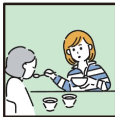
障がいや病気のある家族の身の回りの世話をしている。