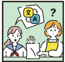
日本語が第一言語でない家族や障がいのある家族のために通訳をしている。